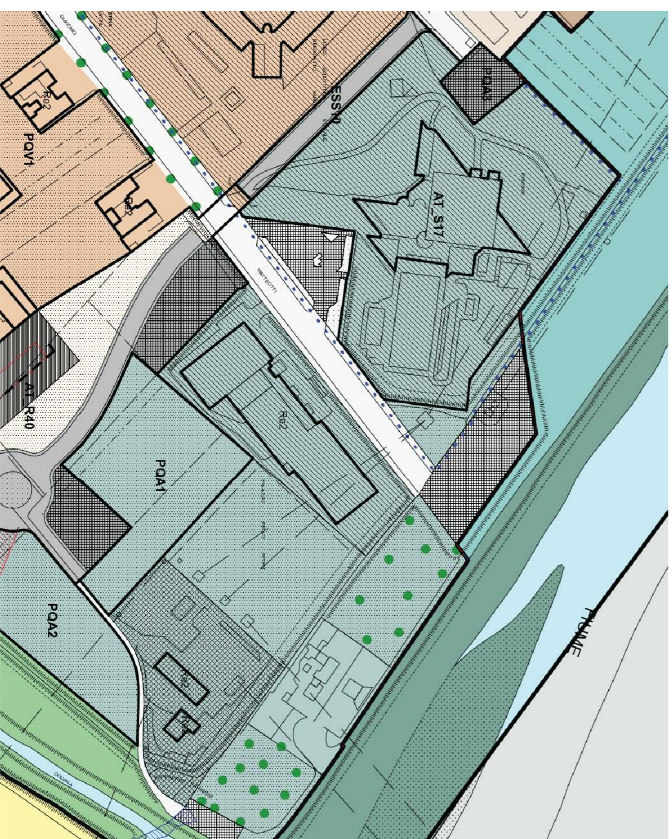
ESTRATTO REGOLAMENTO URBANISTICO